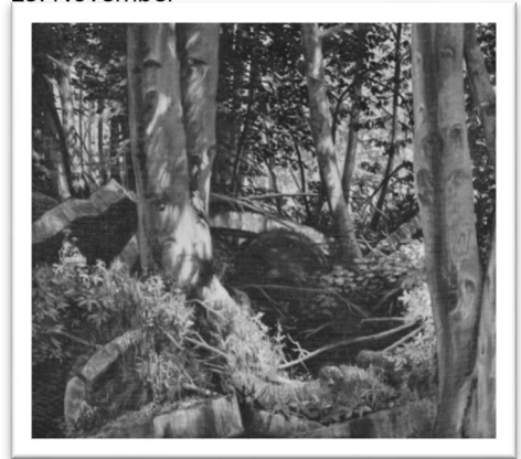
Barth 1, 2018

Ausstellung in St. Lukas - 6. Oktober bis 23. November